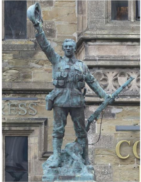
War Memorial in Truro, Foto: Karl-Heinz Lenzner

scheidet den Ersten vom Zweiten Weltkrieg. War der Zweite Weltkrieg die Folge eines verbrecherischen Regimes, so sind die Beteiligten in den Ersten Weltkrieg fahrlässig hineingeraten. Weil Krieg immer noch als Politik mit anderen Mittel verstanden und allgemein akzeptiert wurde, ohne sich bewusst zu sein, was Krieg in einem technisierten Zeitalter bedeutet. Und deshalb ist der Erste Weltkrieg eine Mahnung an uns heute: Krieg wird schrittweise wieder „salonfähig“ – sind wir uns wirklich der Folgen bewusst? Die ökumenische Friedensdekade, die am 100. Gedenktag des Kriegsendes 1918 beginnt, warnt ganz eindringlich vor den Gefahren eines dritten Weltkrieges.