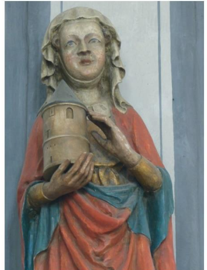
Am 4. Dezember feiert die Kirche den Gedenktag der Märtyrerin und Nothelferin Barbara.