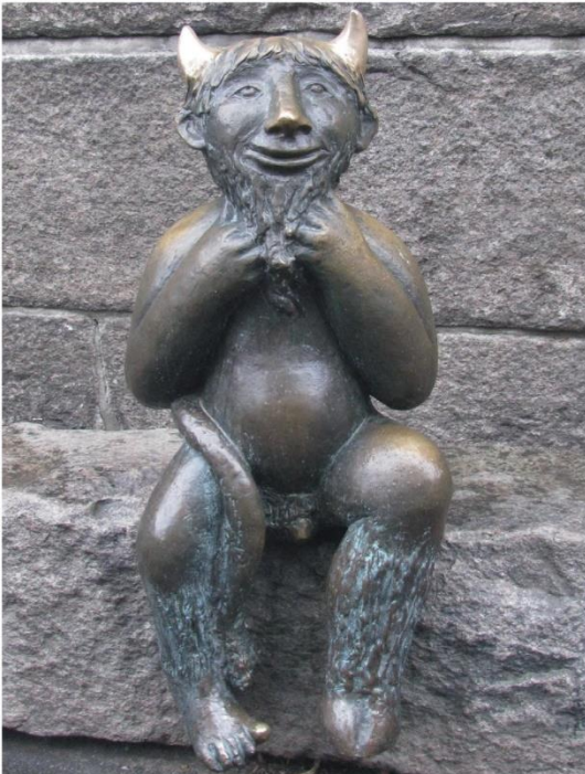
Rolf Goerler, Teufelsfigur, St. Marien, Lübeck 1999, Foto: Peter Kane

Das ist mit wichtig: Denn Versuchungen gibt es heute auch noch, und es ist nicht die Tafel Schokolade, nicht das angesagte Kleidungsstück, sondern es ist wie bei Jesus die Versuchung, sich von Gott abzuwenden. Von Gott abzuwenden, indem ich Menschen schlecht behandle – in der Schule oder im Freundeskreis zum Beispiel. Schlecht über sie rede, Lügen verbreite, sie ausschließe. Mobbing heißt das heute. Und ist nur ein Beispiel, wie ich mich von Gott abwenden kann. Die Fasten- oder Passionszeit lädt dich dazu ein, darüber nachzudenken, wo du dich vielleicht von Gott abgewendet hast, und zu versuchen, das zu korrigieren.